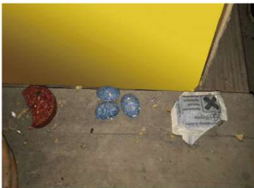
6/3 投置(重新放置一錠鼠)